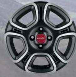
Felgi stalowe stylizowane 15" Street 1M0