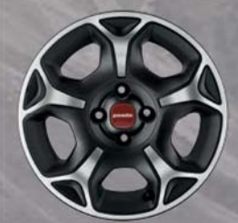
Felgi stalowestylizowane 15" Cross 1M5