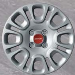
Felgi stalowe 14" z kołpakami 0R4

■ wyposażenie standardowe; - opcja niedostępna; * dla wersji 1.0 70 KM Hybrid