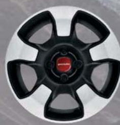
Felgi stalowe stylizowane 15" City Cross 1M8